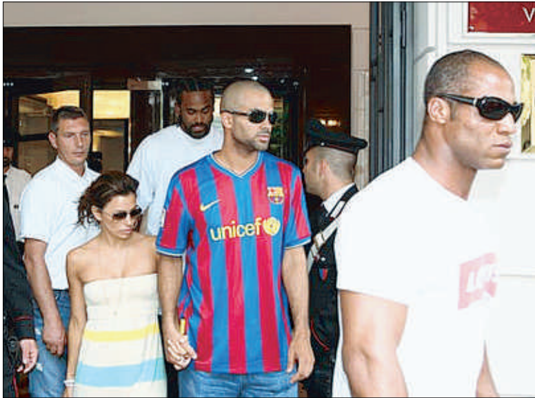
Tony Parker y Eva Longoria asistieron a la final totalmente equipados. Parker llevaba la nueva camiseta Nike.